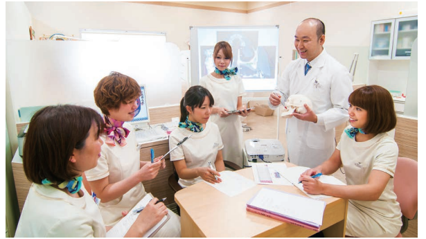
チームとしての医療レベル向上のため、スタッフと定期的にミーティングを行う。